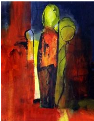
Karte 1 – Motiv „Erscheinung“